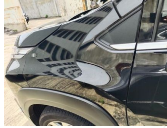
Fender Depan Kiri