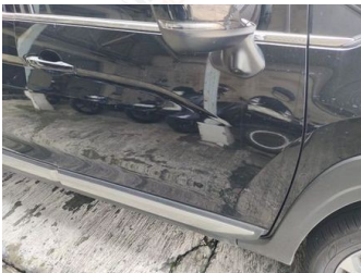
Pintu Depan Kanan