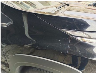
Fender Depan Kanan