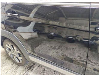
Pintu Belakang Kanan