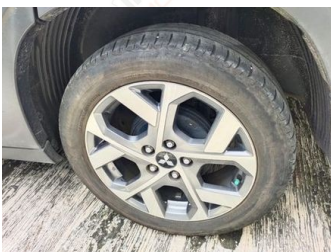
Ban & Velg Belakang Kanan