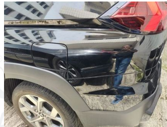
Fender Belakang Kiri