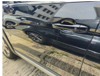
Pintu Depan Kiri