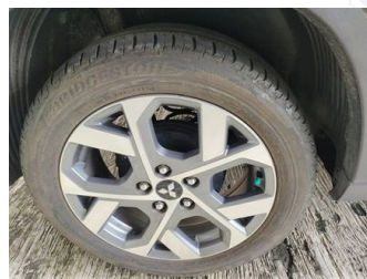
Ban & Velg Belakang Kiri