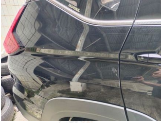
Fender Belakang Kanan