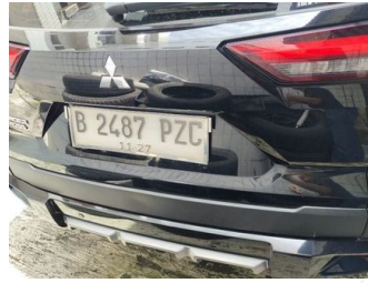
Kap Belakang / Kap Bagasi