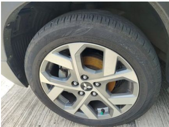
Ban & Velg Depan Kanan