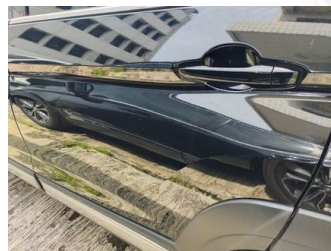
Pintu Belakang Kiri