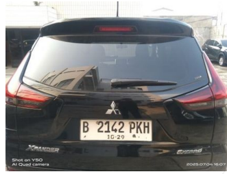
Kap Belakang / Kap Bagasi