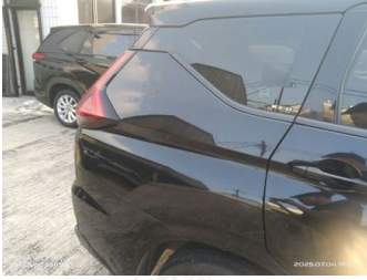
Fender Belakang Kanan