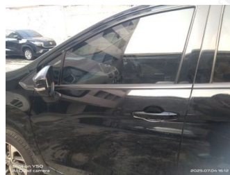
Pintu Depan Kiri