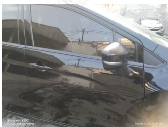
Pintu Depan Kanan