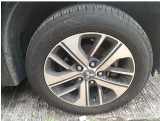
Ban & Velg Depan Kanan