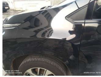
Fender Depan Kiri