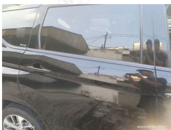
Pintu Belakang Kanan