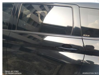
Pintu Belakang Kiri