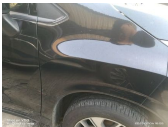
Fender Depan Kanan