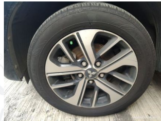
Ban & Velg Depan Kiri