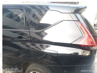
Fender Belakang Kiri