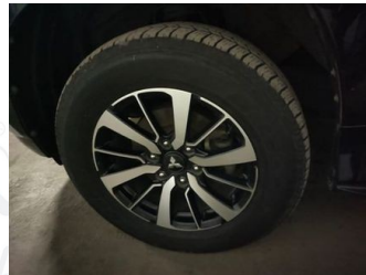
Ban & Velg Depan Kiri