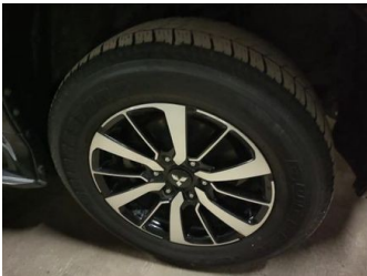
Ban & Velg Depan Kanan