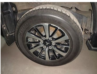
Ban & Velg Belakang Kanan