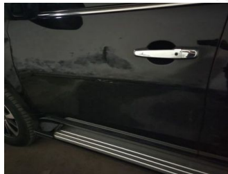
Pintu Depan Kiri