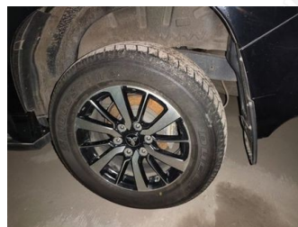
Ban & Velg Belakang Kiri