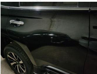
Pintu Belakang Kanan