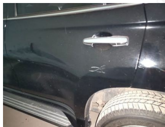
Pintu Belakang Kiri