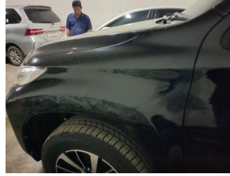
Fender Depan Kiri