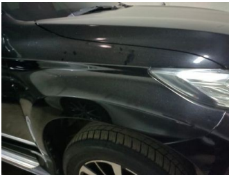
Fender Depan Kanan