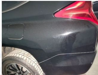
Fender Belakang Kiri