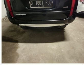
Kap Belakang / Kap Bagasi