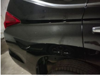
Fender Belakang Kanan