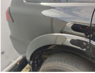
Fender Belakang Kanan