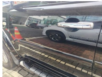
Pintu Depan Kiri