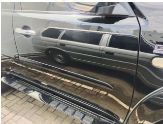
Pintu Depan Kanan