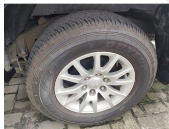
Ban & Velg Belakang Kiri