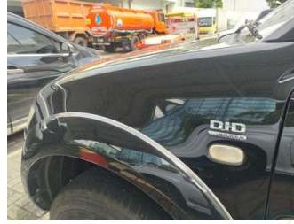
Fender Depan Kiri