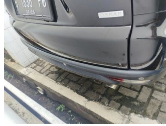
Kap Belakang / Kap Bagasi