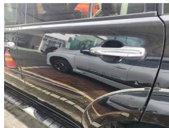
Pintu Belakang Kiri