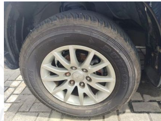
Ban & Velg Depan Kiri