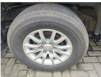
Ban & Velg Belakang Kanan