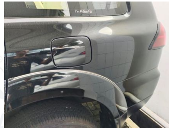
Fender Belakang Kiri