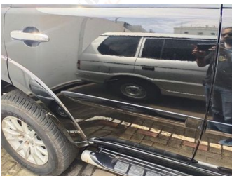
Pintu Belakang Kanan