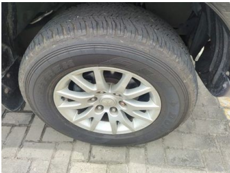
Ban & Velg Depan Kanan