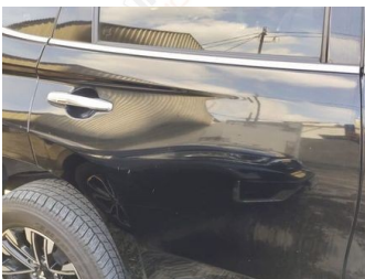
Pintu Belakang Kanan