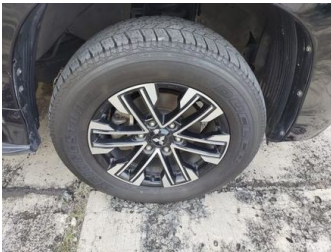
Ban & Velg Depan Kanan