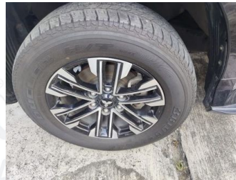
Ban & Velg Depan Kiri