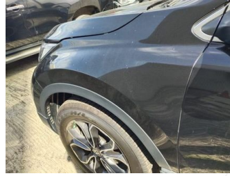
Fender Depan Kiri