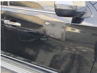
Pintu Depan Kanan