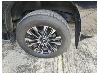
Ban & Velg Belakang Kiri