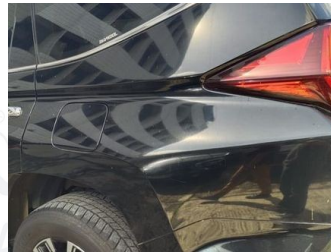
Fender Belakang Kiri