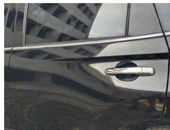
Pintu Belakang Kiri