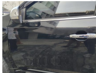
Pintu Depan Kiri