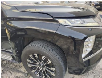
Fender Depan Kanan