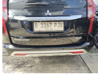
Kap Belakang / Kap Bagasi