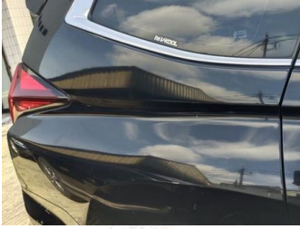
Fender Belakang Kanan