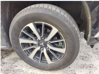
Ban & Velg Depan Kanan