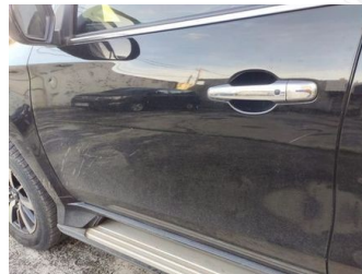
Pintu Depan Kiri