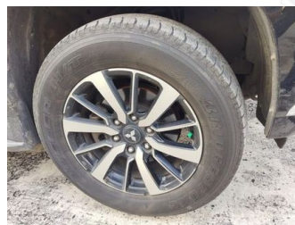
Ban & Velg Belakang Kiri