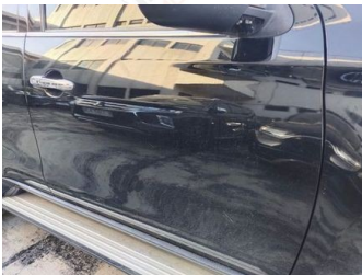
Pintu Depan Kanan