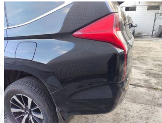
Fender Belakang Kiri