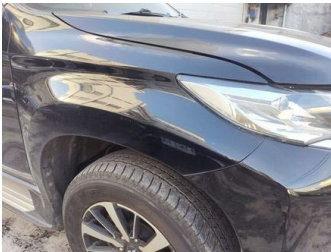
Fender Depan Kanan