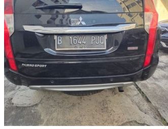
Kap Belakang / Kap Bagasi