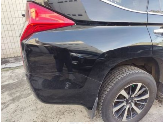
Fender Belakang Kanan