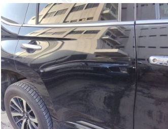
Pintu Belakang Kanan