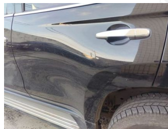
Pintu Belakang Kiri