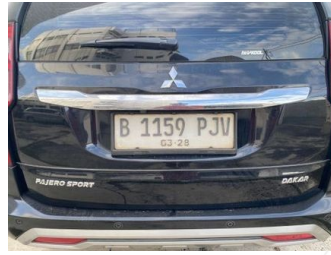
Kap Belakang / Kap Bagasi