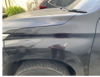
Fender Depan Kiri