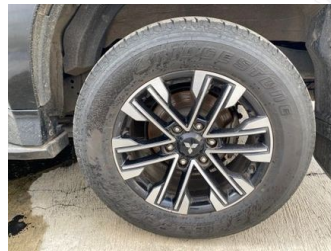
Ban & Velg Belakang Kiri