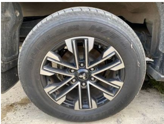
Ban & Velg Belakang Kanan