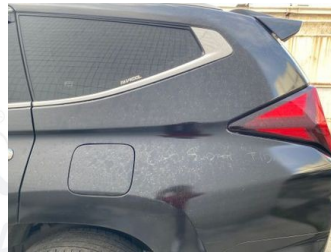
Fender Belakang Kiri