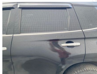
Pintu Belakang Kiri