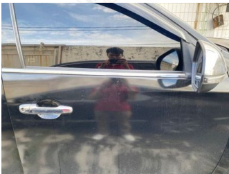
Pintu Depan Kanan