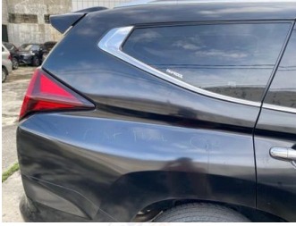
Fender Belakang Kanan