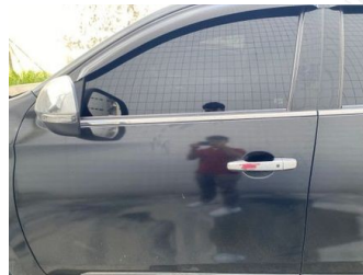
Pintu Depan Kiri