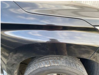
Fender Depan Kanan