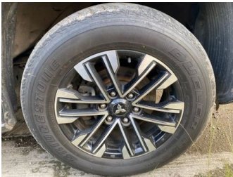
Ban & Velg Depan Kanan