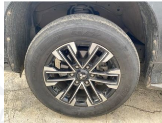
Ban & Velg Depan Kiri