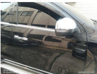
Pintu Depan Kanan