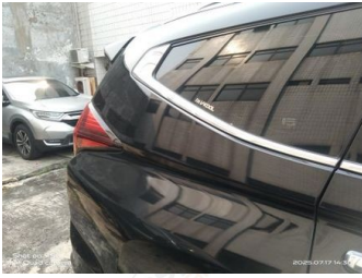
Fender Belakang Kanan