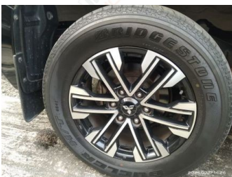
Ban & Velg Belakang Kanan