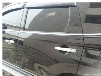
Pintu Belakang Kiri