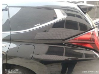
Fender Belakang Kiri