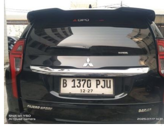
Kap Belakang / Kap Bagasi