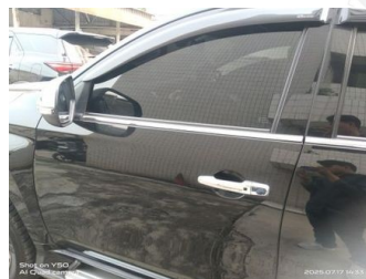
Pintu Depan Kiri