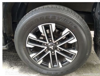
Ban & Velg Belakang Kiri