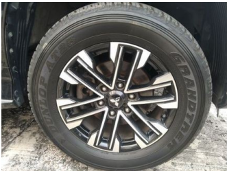
Ban & Velg Depan Kanan