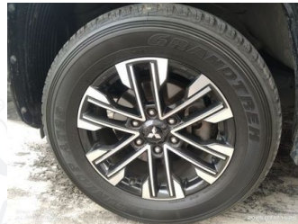
Ban & Velg Depan Kiri