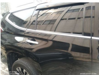
Pintu Belakang Kanan