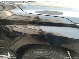
Fender Depan Kanan