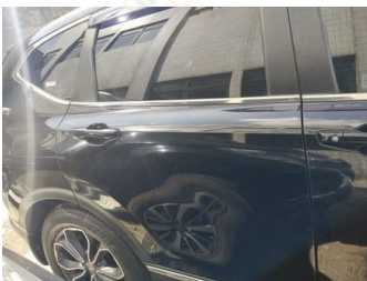
Pintu Belakang Kanan