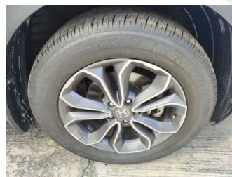
Ban & Velg Belakang Kiri