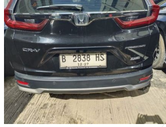
Kap Belakang / Kap Bagasi