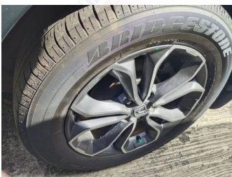
Ban & Velg Belakang Kanan