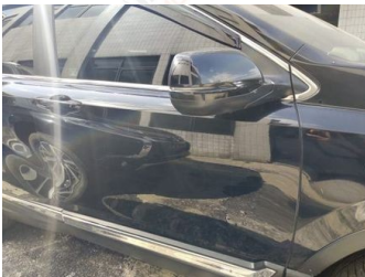
Pintu Depan Kanan