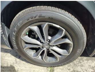
Ban & Velg Depan Kanan