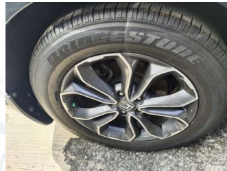
Ban & Velg Depan Kiri