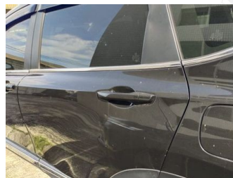
Pintu Belakang Kiri