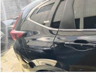
Fender Belakang Kanan