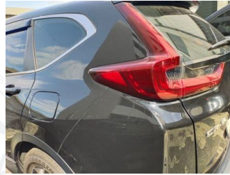
Fender Belakang Kiri