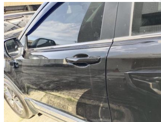
Pintu Depan Kiri